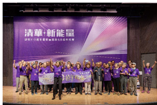
1974年畢業校友帶領全場重呼當年梅竹賽的隊呼「清華加油！我是清華！我們是清華！」