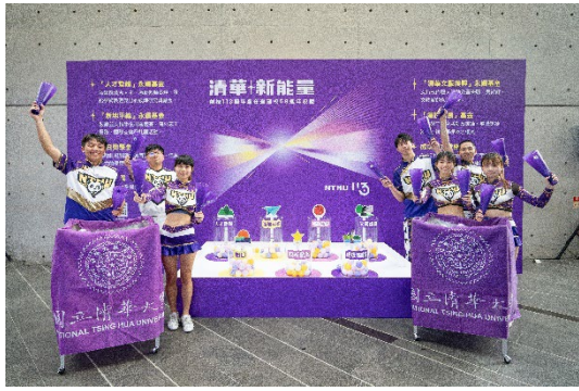
本校啦啦隊為「清華新能量」活動吶喊加油。