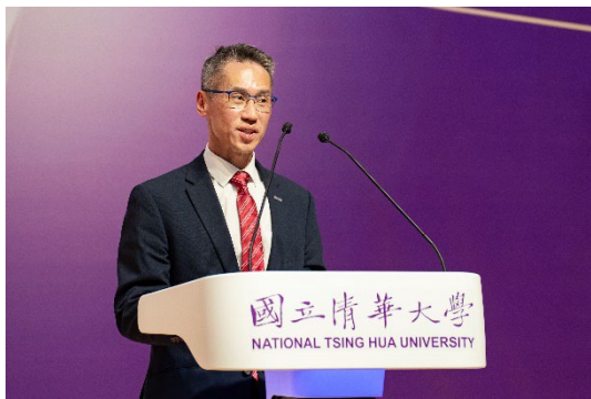
本校高為元校長表示，今年校慶主軸「清華新能量」，希望引進更多校友及社會大眾的力量，轉動並激發出一股新能量。