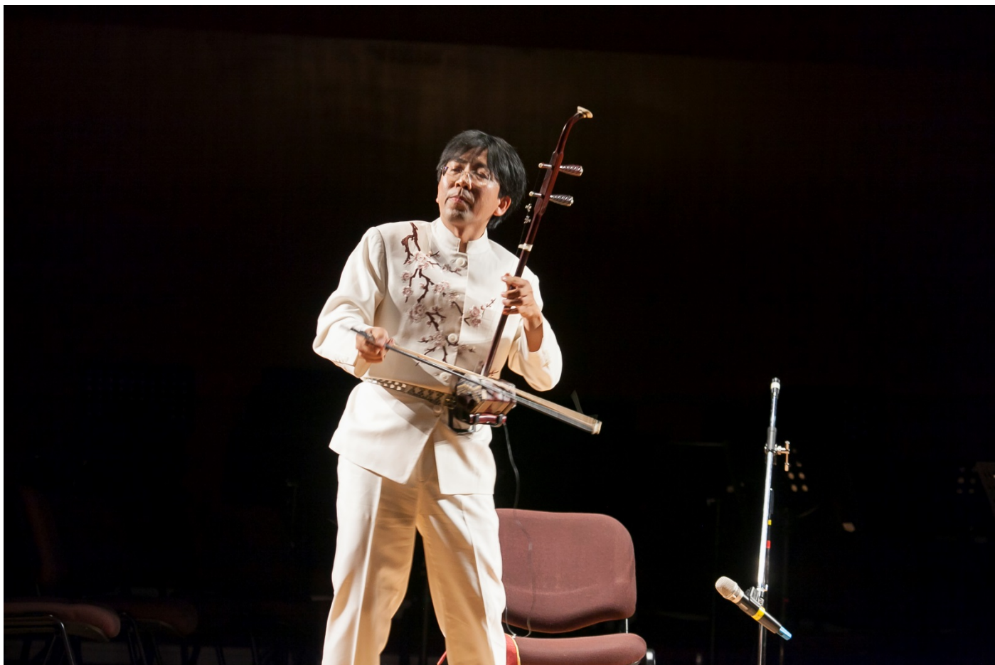
音樂會活動特別邀請中國二胡演奏家-杜恩武來台演出。