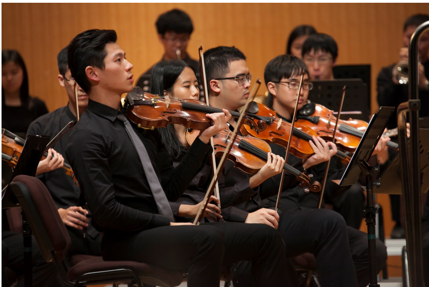
清華愛樂管弦樂團由清華學生組成。