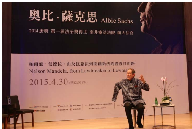
首屆唐獎法治獎得主奧比·薩克思清華開講 分享人權奮鬥史。