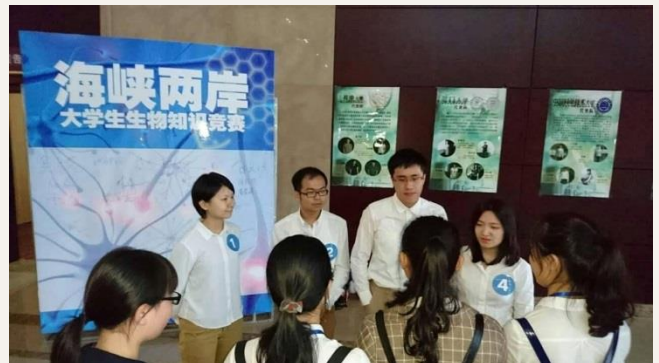
奪冠後，本校四位選手於賽後隨即接受廈大媒體小組的採訪。