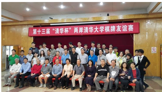
第十三屆兩岸清華大學清華盃圍棋橋藝交流友誼賽日前於北京清華大學舉行。

由於兩項比賽皆平手，故此交流賽之結果為和局收場，可謂雙贏，恰如吳副校長於開幕式所言。但依規定總錦標由客隊取得，是以今年由本校贏得總錦標。此次活動在技術及經驗的切磋與交換下圓滿落幕，第十四屆將再度由本校主辦，延續傳承兩校的情誼，希望能有更進一步的嘗試與合作交流機會，帶領兩校共創新契機。