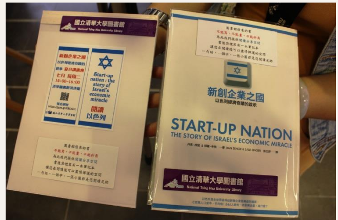
打破過去圖書館借來的書「不能寫、不能畫、不能折角」慣例，清華圖書館特別在每本書背後面加工裝袋，放置筆記本，讓讀者可以分享讀後心得。