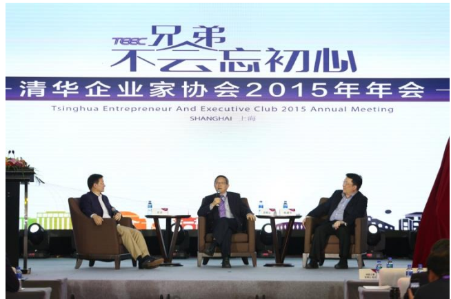
賀陳弘校長(圖中)回應企業家校友提問。(圖右：北京清華大學程建平副校長；圖左：TEEC 前任會長方學長)程建平。