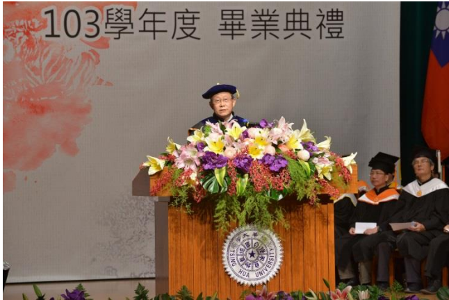
賀陳弘校長勉勵畢業生以運動家精神面對人生。