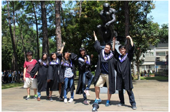
清華合唱團同學畢業前一起跟沉思者銅像拍照。