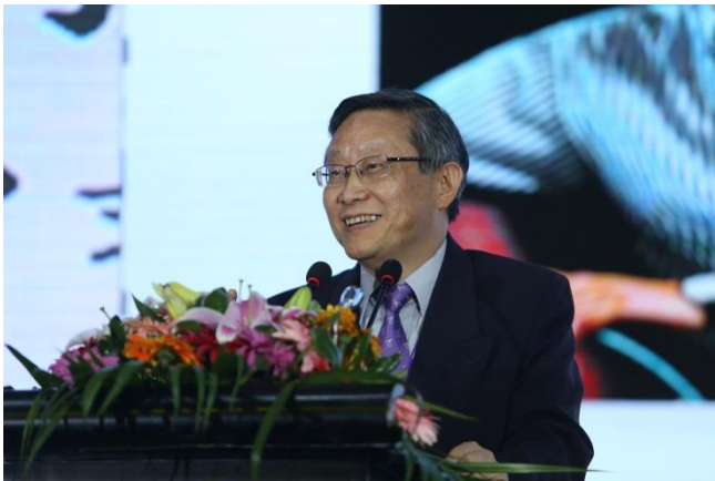
賀陳校長於 TEEC 主題年會發表演講。