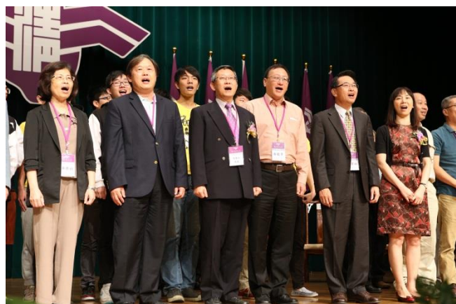
校長與貴賓合唱校歌。