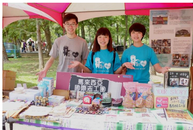
馬來西亞志工團展示活動成績並義賣。