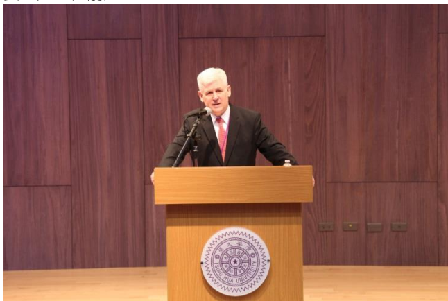
AIT 處長馬啟思於清華演講。

馬啟思處長在演講中表示，世界上的人有 60% 是 30 歲以下的年輕人，他們是促進社會進步的動力，美國政府很重視年輕人的發展。從去年的選舉活動中，他看見世代的改變，臺灣的年輕人並不像一般所說的草莓族，而是堅強、有動力，擁有強大的信念。他鼓勵臺灣年輕人不用為眼前所遭遇的困難而氣餒，要堅定地往前走。