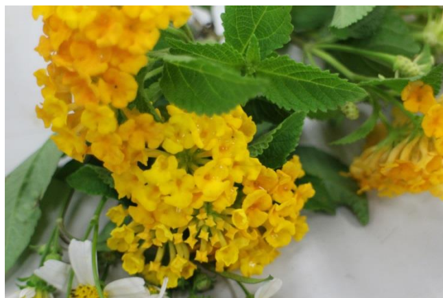
這次研究所觀察仿效的植物之一便是校園常見的馬櫻丹。

詳細內容，可見發表於先進功能材料(Advanced Functional Materials)的文章(文章名稱:“Anisotropic Wettability of Biomimetic Micro/Nano Dual-Scale Inclined Cones Fabricated by Ferrofluid-Molding Method”, DOI: 10.1002/adfm.201500359)。