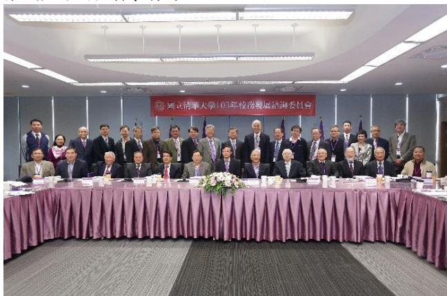
諮詢委員與本校主管合影。