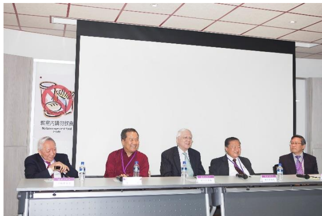
分組座談-人文管理領域。