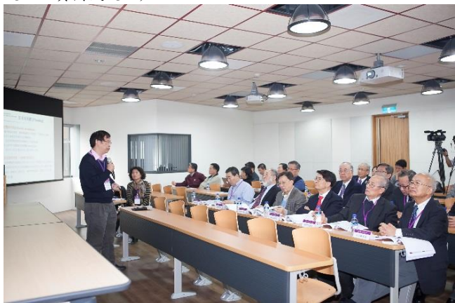
分組座談-自然科學領域。