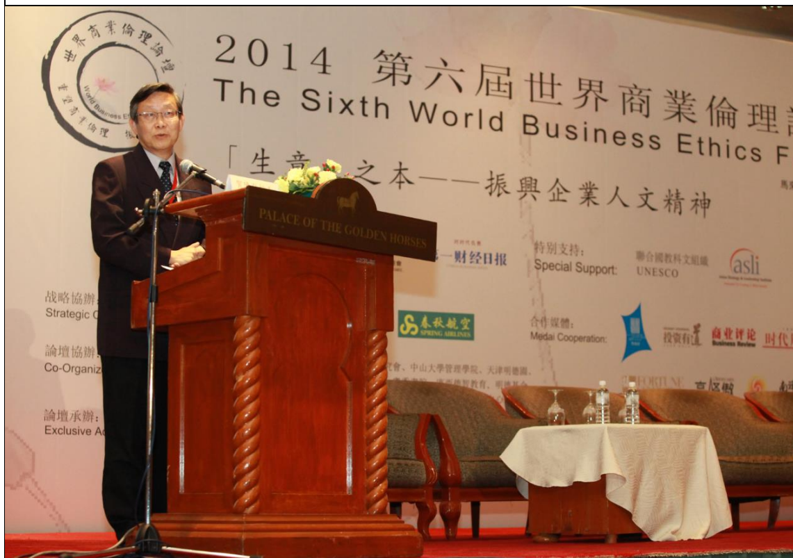
賀陳弘校長發表專題演講「高校當如何落實倫理教育」