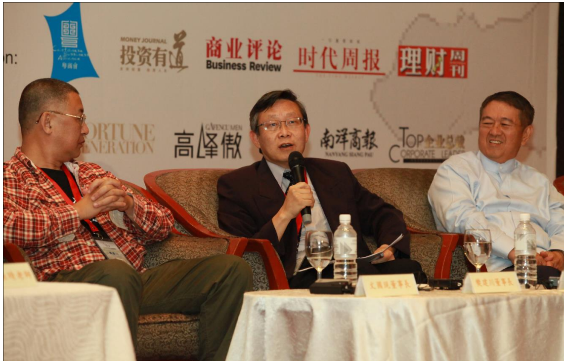
賀陳弘校長參與世界商業倫理論壇