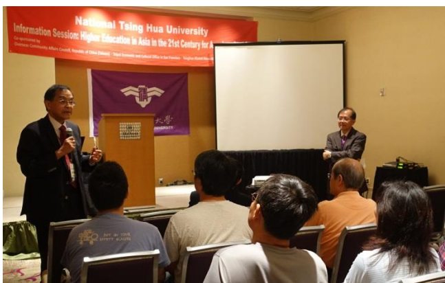
國立清華大學於 8 月 17 日在北加州辦理招生說明會