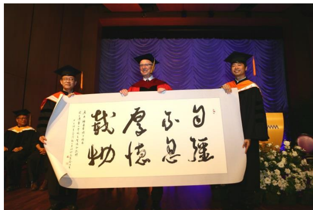
國立清華大學於 8 月 19 日頒發名譽博士學位並致贈清華校訓書法，給高通公司 (Qualcomm Corporation) 共同創辦人厄文·雅各布 (Dr. Irwin Jacobs)。