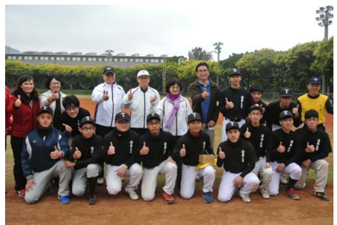
壘球第一次進到梅竹項目，圖為壘球隊。