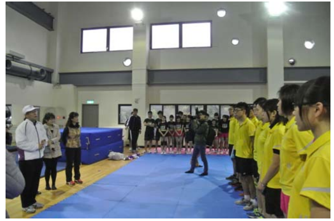
校長勉勵羽球隊隊員。