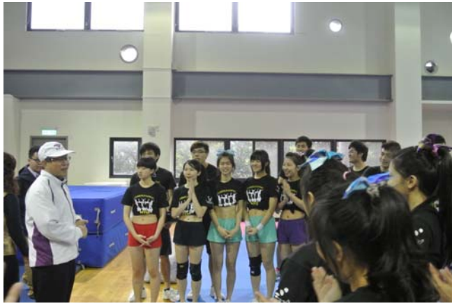
啦啦隊也是梅竹不可或缺的成員。