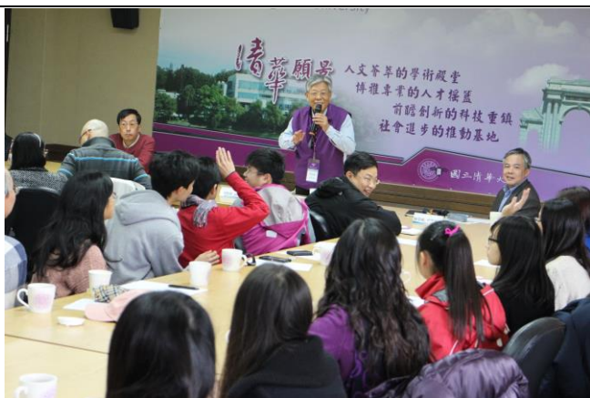
本校特殊選才「拾穗計畫」新生座談會，多元人才齊聚。

座談會除說明新生入學後之事宜之外，也著重協助學生大一輔導課程、生活照顧及校園生活接軌等，因此安排學生及家長參觀校園及清華學院，期望能幫助學生進行個人發展、生涯探索及團體參與，使之為清華校園注入新元素，並學習其他領域的知識，發揮個人價值及拓展新視野。