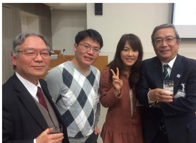
左一東工大里達雄教授，右一東工大三島校長。