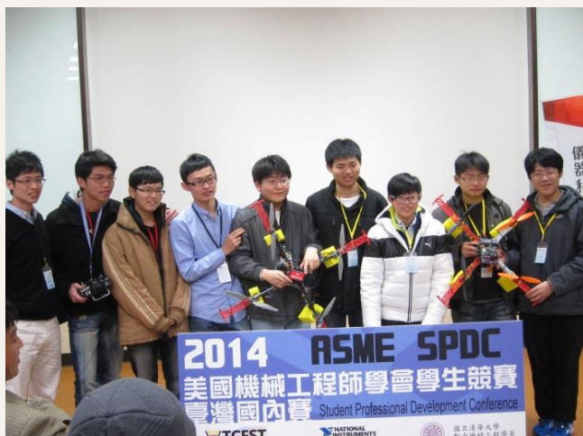
DIT Robotics 獲得 ASME 學生競賽台灣區第一名。

DIT 的意思是 Design In Taiwan，自己設計並實現腦海中的想法，希望能扭轉大家對台灣代工的印象 (Made In Taiwan)，並且同時在清大校園內提倡『動手做』這個概念。DIT 同時也是 Do Improve Try，團隊不只提出創新的想法，同時動手將想法實現，努力改良並且不斷的嘗試。目前團隊全力準備今年 6 月於德國德勒斯登舉辦的全自動機器人大賽 EUROBOT 決賽，希望能藉由參加實作機器人的競賽，磨練實作的能力，增強解決問題的能力，並獲得勝利。