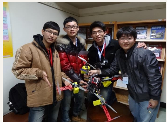
此次參展的四旋翼飛行器於 2013 年 6 月開始研發，為 DIT 團隊所打造的第四版飛行器。