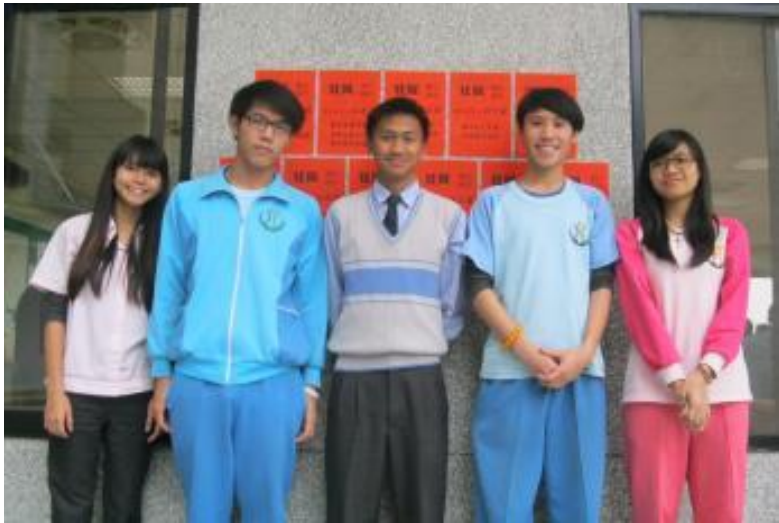
小清華繁星成績亮眼 產生五名準大學生