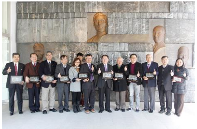
本校致贈紀念牌給當日出席記者會的學長姐。