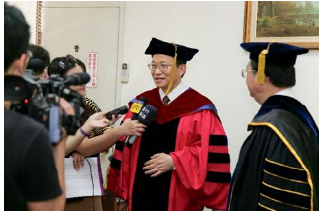
張教授接受媒體訪問。