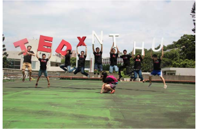
TEDxNTHU 2013 年會：「是誰在創造任意門？」

賀 碩士班高瑋毅同學的論文「Pangcah人在南非：遷移與適變」在「第三屆兩岸清華大學研究生學術論壇」中被評為優秀論文