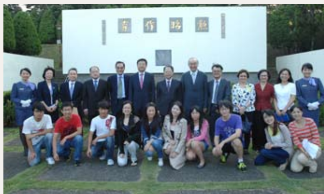
兩岸清華人一同於梅園合影留念