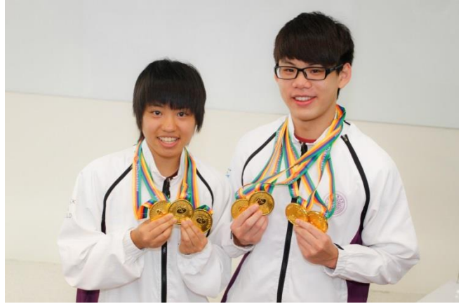
清華學生運動表現優異，參加各項賽事屢獲佳績。