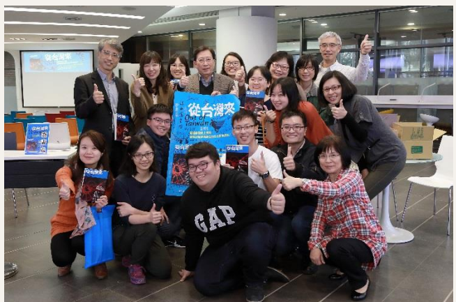
劉兆玄教授與來參與《從台灣來》新書分享會的粉絲合影。