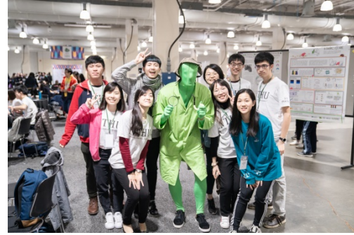
本校 NTHU Formosa 團隊在競賽會場與其他國家隊伍交流合成生物學的創新想法。