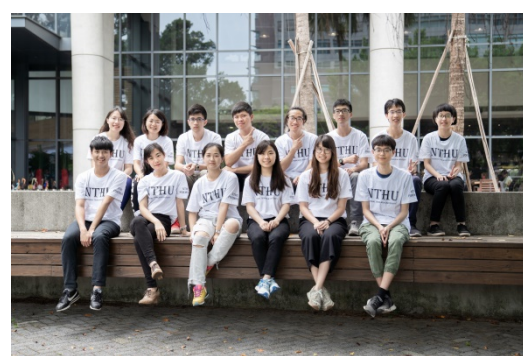
NTHU Formosa 團隊成員除來自醫科系，還有應科系、生科系、生醫工程與環境科學系、電機系與系統神經科學研究所的學生