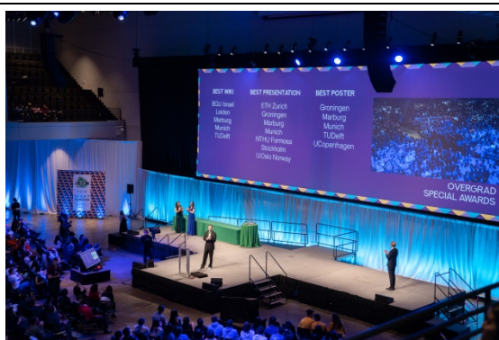
本校 NTHU Formosa 團隊 10 月底赴波士頓參 iGEM 國際競賽奪得金牌。