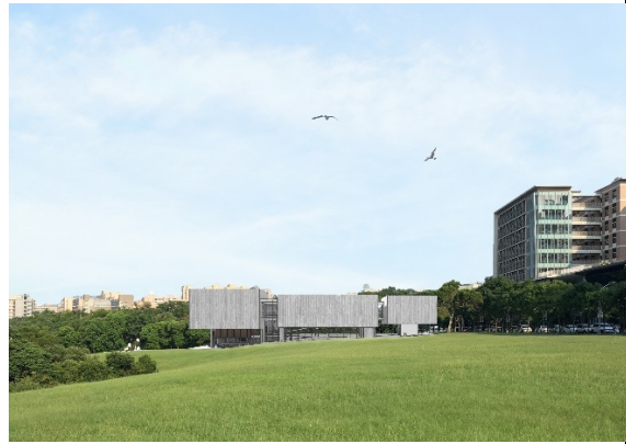
本校「謝宏亮現代美術館」地點示意圖。