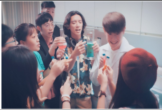
清華放榜預告短片向準大學生展示清華多元、跨域學習的校園風氣。(影片截圖)