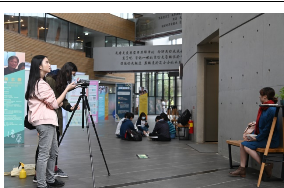
清華放榜預告短片從從編劇、導演、演出、剪輯及後製全由清華學生包辦。