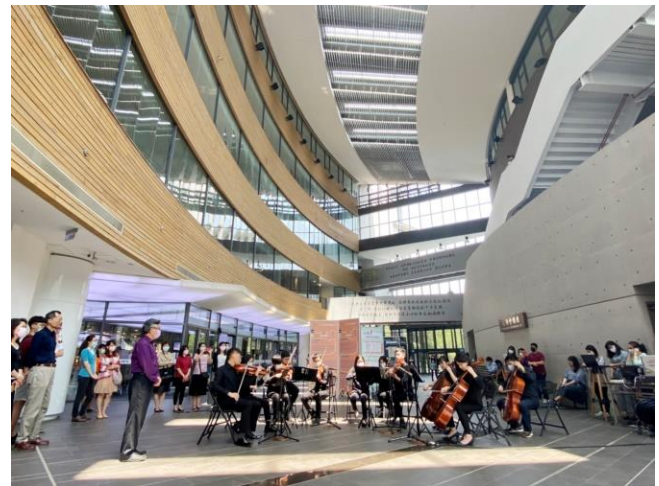
為慶祝校慶，清華在旺宏館 1 樓舉辦一場音樂快閃