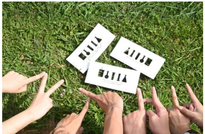
本校今年將郵寄紙本的錄取通知卡片給正取生及備取生，卡片呼應放榜預告片中「人生實驗室」的概念