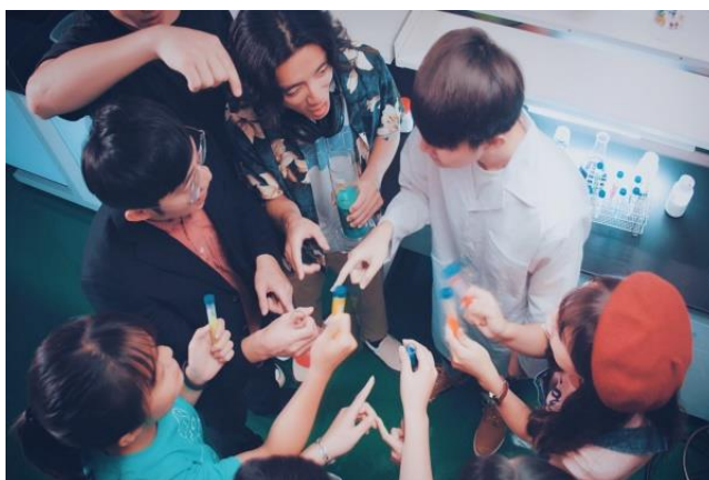
清華放榜預告短片向準大學生展示清華多元、跨域學習的校園風氣（影片截圖）