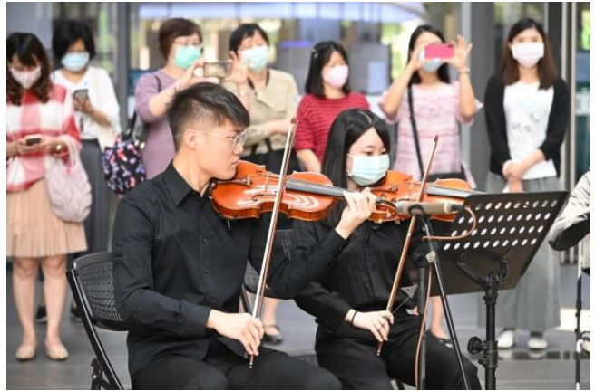
為慶祝校慶，清華在旺宏館 1 樓舉辦一場音樂快閃