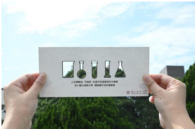
本校今年將郵寄紙本的錄取通知卡片給正取生及備取生，卡片呼應放榜預告片中「人生實驗室」的概念