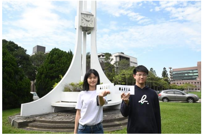
本校今年將郵寄紙本的錄取通知卡片給正取生及備取生