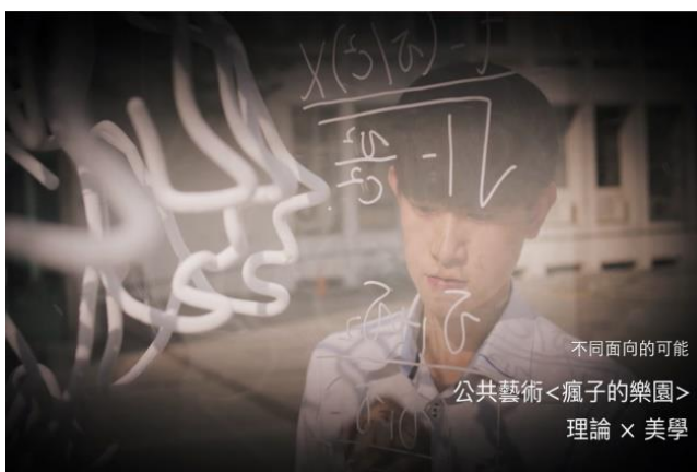
清華放榜預告短片中呈現校園內的公共藝術（影片截圖）