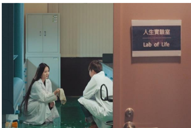
清華放榜預告短片以「人生實驗室」為主題（影片截圖）