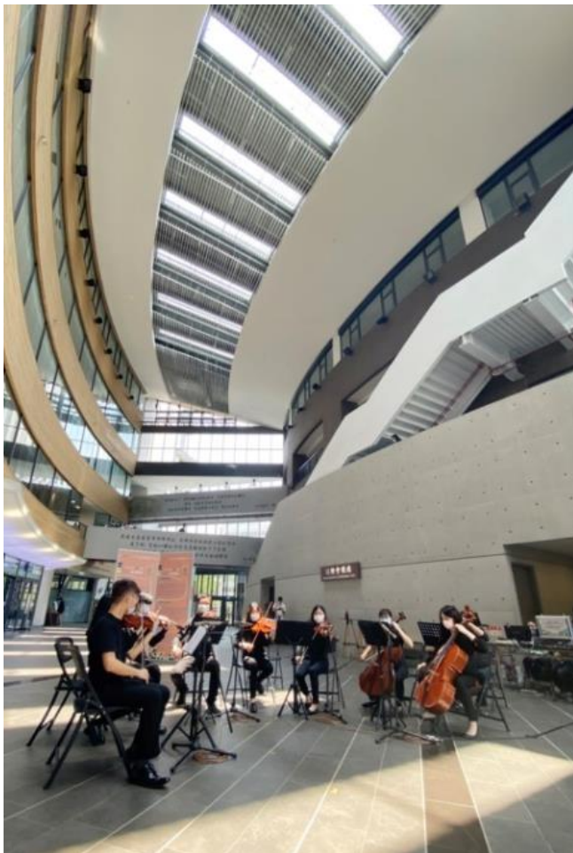
為慶祝校慶，清華在旺宏館 1 樓舉辦一場音樂快閃