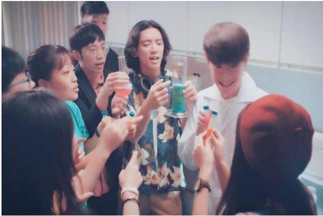
清華放榜預告短片向準大學生展示清華多元、跨域學習的校園風氣（影片截圖）