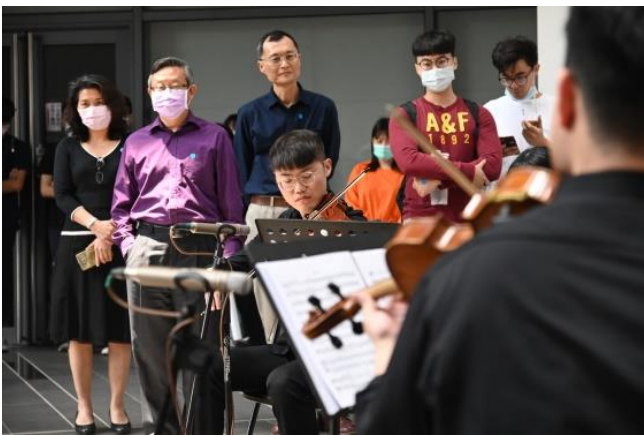
為慶祝校慶，清華在旺宏館 1 樓舉辦一場音樂快閃