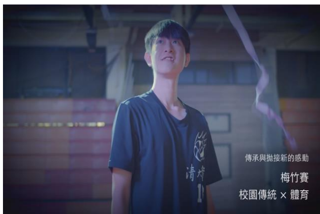
清華放榜預告短片中呈現清華校園傳統—梅竹賽（影片截圖）