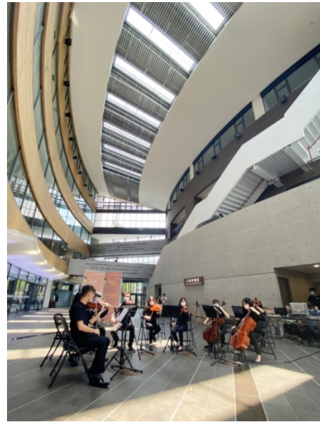
為慶祝校慶，清華在旺宏館1樓舉辦一場音樂快閃。