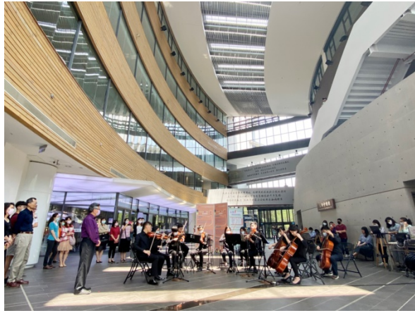
為慶祝校慶，清華在旺宏館1樓舉辦一場音樂快閃。