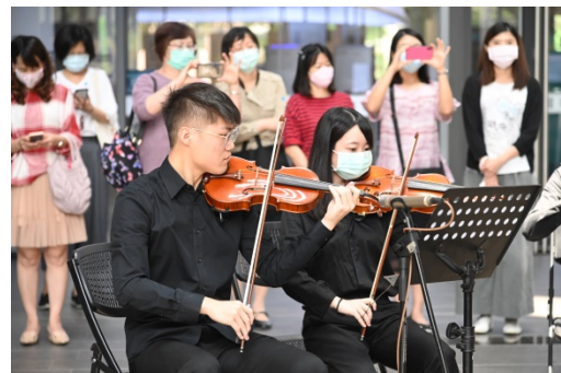
為慶祝校慶，清華在旺宏館1樓舉辦一場音樂快閃。