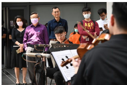
為慶祝校慶，清華在旺宏館1樓舉辦一場音樂快閃。