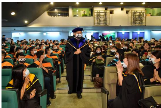
本校設計製作繪有清華吉祥物貓熊圖案的口罩套，送給全體畢業生。