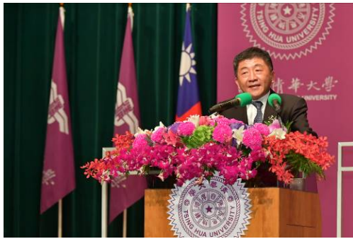
衛福部陳時中部長於清華畢業典禮致詞時勉勵畢業生合作、體諒、聆聽。