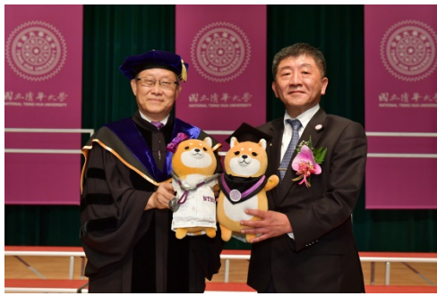
本校賀陳弘校長(左)致贈特製的總柴、總柴夫人紀念布偶給衛福部陳時中部長。