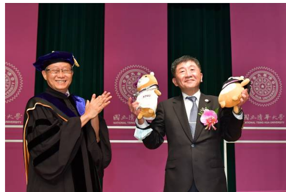
本校賀陳弘校長(左)致贈特製的總柴、總柴夫人紀念布偶給衛福部陳時中部長。