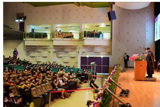
本校賀陳弘校長邀請全體師生為抗疫英雄陳時中部長鼓掌。