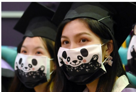
本校致贈全體畢業生繪有清華吉祥物貓熊圖案的口罩套。