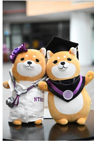
本校手工製作「總柴」與「總柴夫人」布偶，送給陳時中部長。