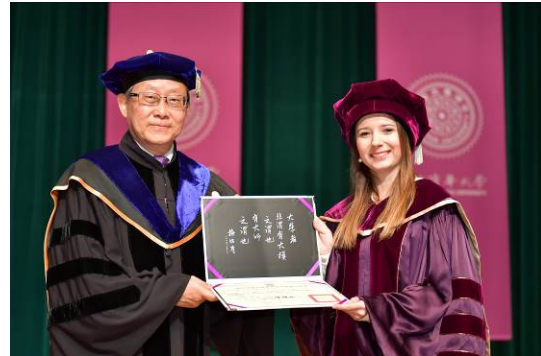
清華賀陳弘校長頒發畢業證書給外籍博士生。