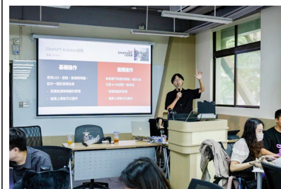
本校是全台第一所針對生成式 AI 成立工作小組的大學，為全校學生開設 AI 工作坊。