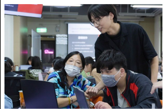
本校是全台第一所針對生成式 AI 成立工作小組的大學，為全校學生開設 AI 工作坊。