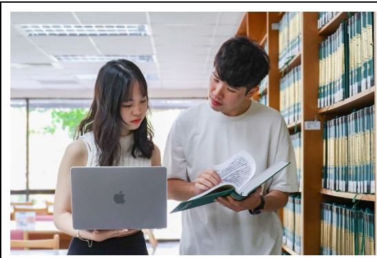
本校人社院學生應用 ChatGPT 分析史料、歸納重點。