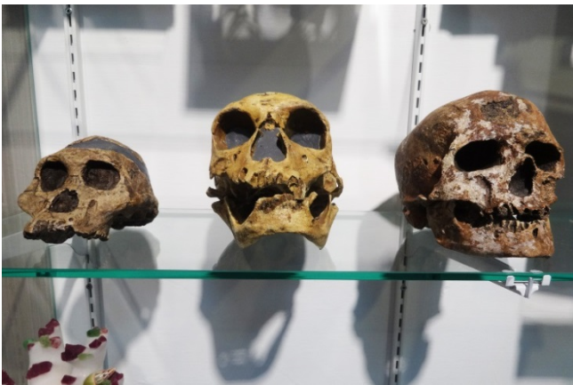
「非洲南猿」、「尼安德塔人」、「現代智人」標本模型。