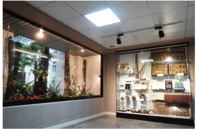
「生物資源保種研究中心」展示區位在清大生科院生命科學二館大廳及中庭，除展示近百種鳳梨科植物的特殊熱帶植物，同時也在此打造可呈現特有收藏的玻璃櫥窗。