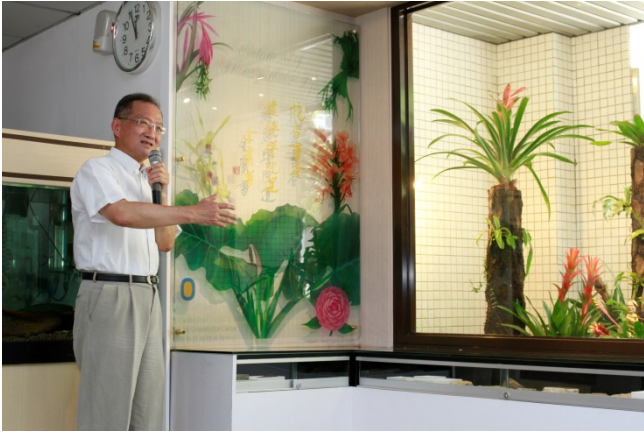
李家維教授經本校名譽博士金庸同意，將金庸提給劍橋大學的「花香書香繾綣學院道」，為他所建立的熱帶植物庭園「百鳳園」落下最美的註解。