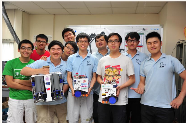
DIT Robotics 與他們的機器人。

動手實作、勇於嘗試和不斷改進是 DIT Robotics 團隊一貫的宗旨，這次的成功對於學生們來說是一個很大的鼓舞。理想是能夠實現的，只要願意動手去做，成功的可能性就永遠存在。