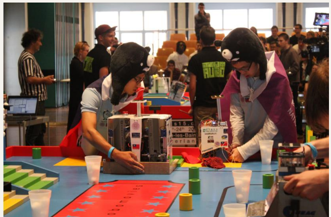
DIT Robotics 頭戴台灣黑熊帽身披國旗與校旗參加比賽。