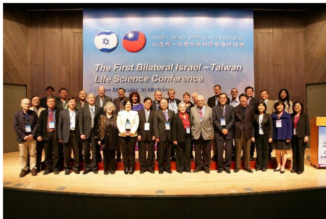
台灣與以色列有史以來最大規模的生命科學研討會，於 12 月 9-11 日在清華大學舉行

屆以色列—台灣生命科學雙邊研討會」系列活動外，12 月 12 日及 13 日，以色列學者將參訪中山大學及高雄醫學大學，並發表專題演講。12 日上午，以色列代表團也在本校馮達旋副校長及以色列駐台代表處何靈夢大使的陪同下，前往總統府拜訪馬英九總統。