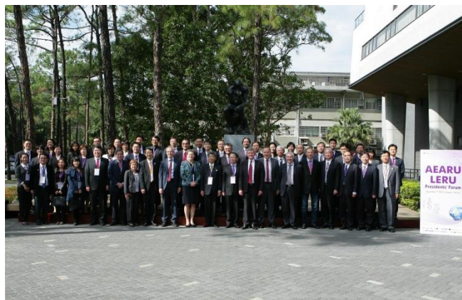
AEARU-LERU 的代表一同合影紀念。

新和全面性研究的推廣」。LERU 認為，基礎研究在創新過程中扮演著重要的角色，並大大有助於社會的進步。