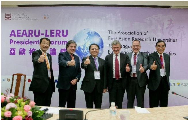
亞、歐研究型大學協會首次共聚一堂召開論壇。

歐洲研究型大學聯盟 (LERU) 成立於 2002 年，是由歐洲 21 所偏重研究的高水平大學組成的聯盟。根據聯盟創立的使命宣言 (Mission Statement)，聯盟的宗旨為：「致力於教育、知識創