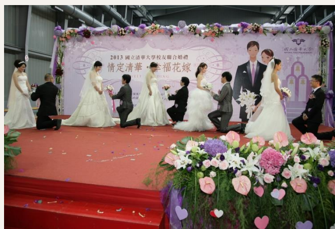
活動現場，新郎持捧花向新娘求婚。