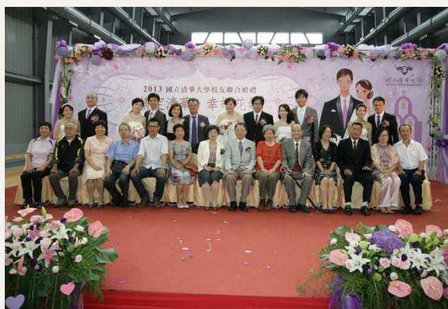
清華首次舉辦校友集體結婚，5對新人一同攜手步入紅毯。

本校先前舉辦「甜蜜清華」活動，鼓勵校友們上傳婚紗照，獲得校友熱烈的迴響；「情定清華，幸福花嫁」也為參加的新人留下甜甜蜜蜜的回憶。