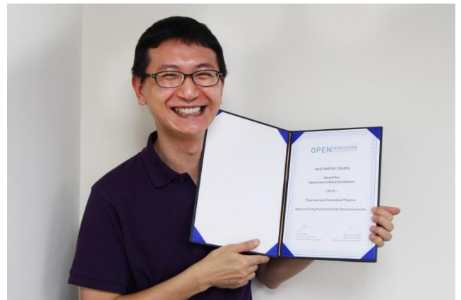
林秀豪教授所開設的「熱統計物理」於全球開放式課程聯盟年度大會中，獲得多媒體類的年度大獎。

開放式課程網站，除了提供全球開放式課程計畫所需的資源外，更扮演意見交流與未來規劃的橋樑。每年舉辦聯盟大會，除提供成員相互交流學習的機會外，也表彰對開放式課程有重要貢獻的人員、計畫與課程。清華大學開放式課程網站由教學發展中心所建構維護，目前共提供54門課程影片可進行線上觀看，涵蓋工程、自然科學及人文社會三大學群，由基礎學科延伸至專業科目，為各領域具清華特色的典範課程。