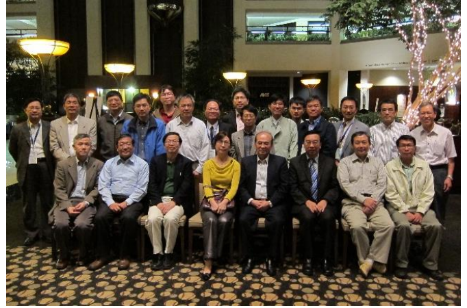
陳文華教授獲國際計算及實驗工程與科學會議「終身成就獎(LIFE-TIME ACHIEVEMENT MEDAL)」殊榮，多位出席的學者一同合影恭賀陳教授。