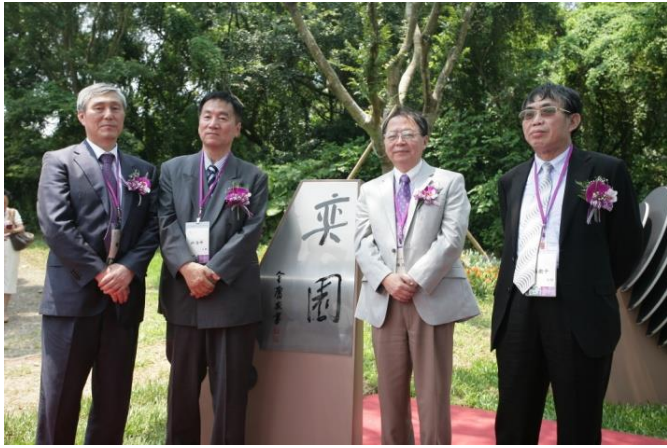
陳力俊校長(右二)、林海峰大師(左二)、聶衛平大師(右一)及曹薰鉉大師(左一)於奕園石碑前合影。