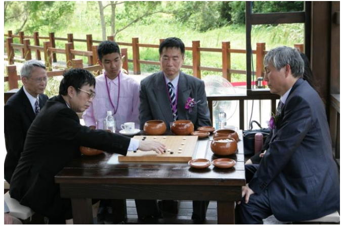
林海峰、聶衛平及曹薰鉉三位大師於奕亭內聯手進行奕紀念棋。