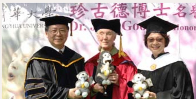
恭禧新的清華人珍古德博士(中)，右為陳力俊校長，右為謝小夢主委。

此後，珍古德持續研究黑猩猩至今，長達50年。1977年，珍古德博士建立了珍古德研究會，推動野生動物保育和環境教育計劃，她更在1991年啟動「根與芽環境教育項目」，教育未來年輕一代如何尊重關懷生命，了解環境，與環境產生良好的互動，改善環境。根與芽計畫發展迅速，截至2011年，成立根與芽小組的國家已經超過120幾個，全世界共有超過12000個小組成立，而台灣就已有680個小組。