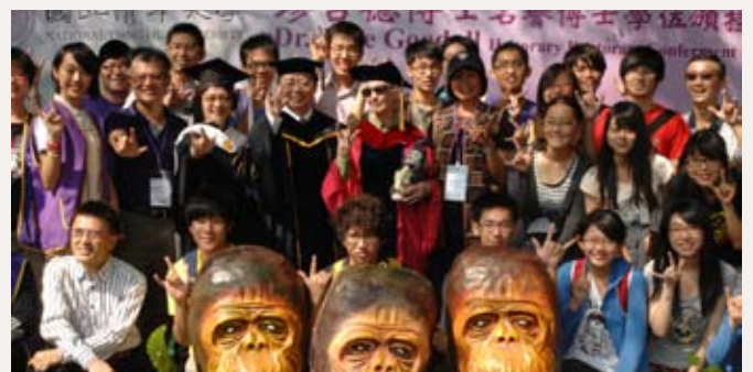
現場工作人員及學生與珍古德博士合影留念，前排為三個學生手作的黑猩猩面具。