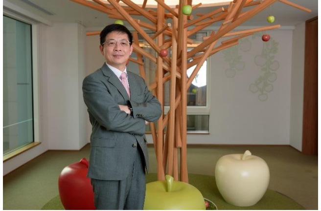
黃男州校友 2017 年再度榮獲財資雜誌 (The Asset) 「亞洲最佳 CEO」，並帶領玉山銀行榮獲「Gartner 全球最佳資訊資料治理獎」，是亞洲唯一獲獎企業。