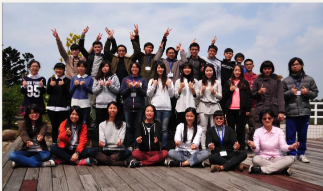
特殊選才新生來清華參加座談會，也提前體驗清華人生活。

清華特殊選才錄取新生一律進入清華學院學士班就讀，大一為不分學系，大二再依志願及興趣分流選系。