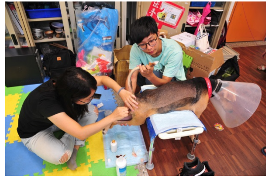
清華懷生社同學為茶茶清潔身體