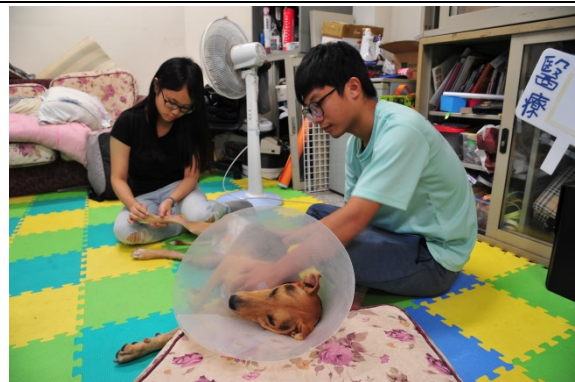
清華懷生社學生為茶茶按摩