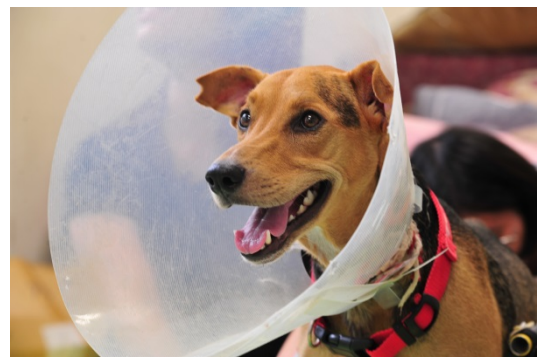
目前正受清華懷生社悉心照顧的茶茶