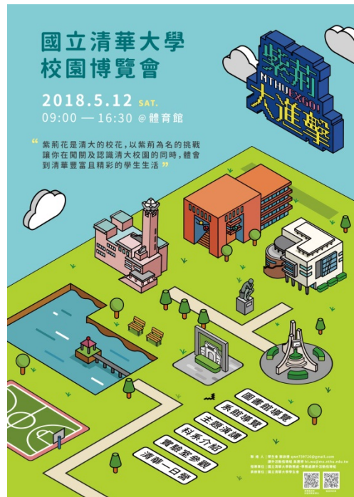
紫荊季活動邀請高中學子認識清華大學生活