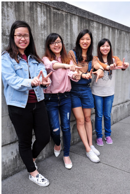
清華紫荊季「紫荊大進擊」挑戰，請高中生發揮創意用肢體排出清華英文縮寫 NTHU