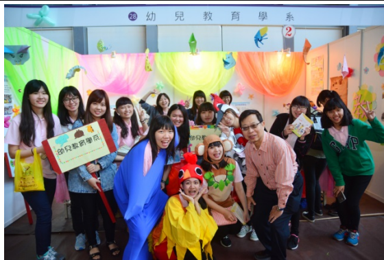
去年的清華紫荊季幼教系學生穿上幼兒劇可愛動物裝，吸引高中生目光