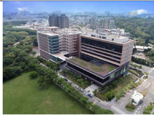
清華實驗室(左)與創新育成大樓(右)

美國發明家學院和智慧產權人協會公布全球大學及學術機構 2017 年獲美國專利核准件數的百大排名，清華獲美國專利排名全台第一。