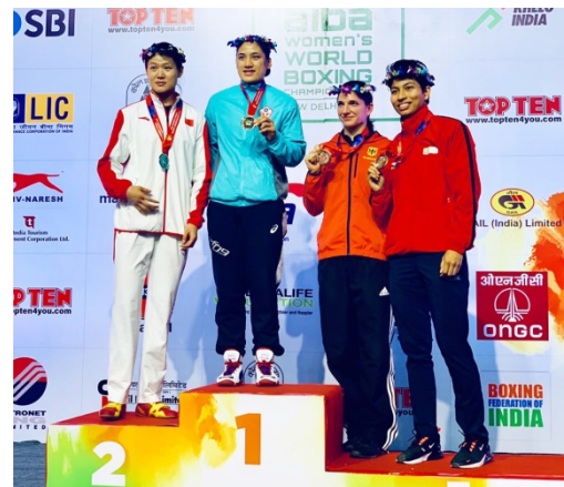
陳念琴勇奪 2018 世界女子拳擊錦標賽 69 公斤量級金牌