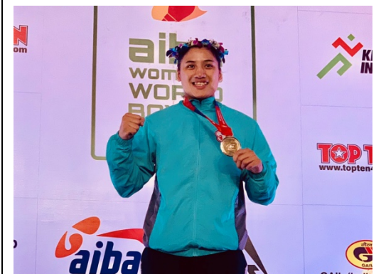
陳念琴勇奪 2018 世界女子拳擊錦標賽 69 公斤量級金牌