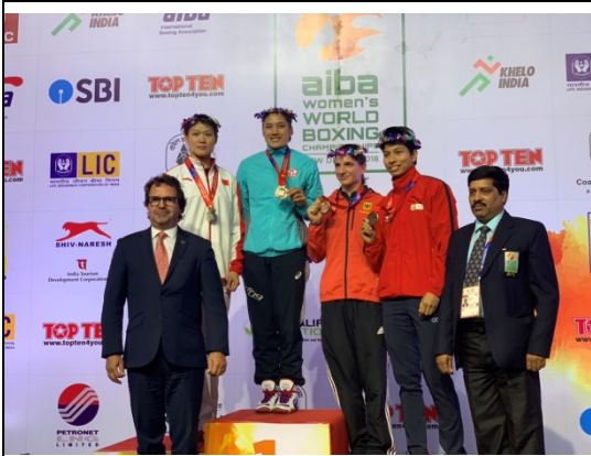
陳念琴勇奪 2018 世界女子拳擊錦標賽 69 公斤量級金牌