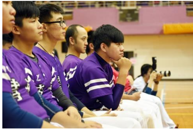
陳偉殷為本校體育系及棒球隊學生帶來講座課程