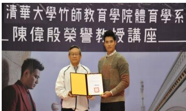
本校賀陳弘校長（左）頒給陳偉殷榮譽講座教授證書

陳偉殷表示，美國職棒大聯盟的球團都走向高科技輔助，他曾經像許多球員一樣鐵齒，不相信這些數據能有什麼幫助，最後卻不得不相信。他很看好運動科技在棒球項目的發展，人工智慧的加入，除了可更幫助教練精準調度，也能改善球員運動傷害。