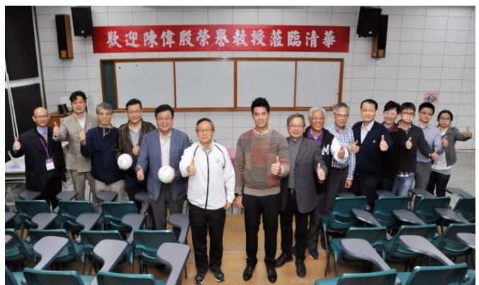
本校賀陳弘校長（白衣者）歡迎陳偉殷擔任清華體育系榮譽講座教授