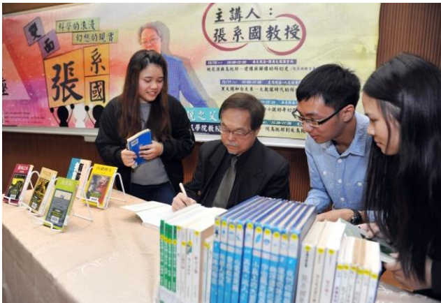
本校學生帶來張系國教授作品，請大師簽名留念