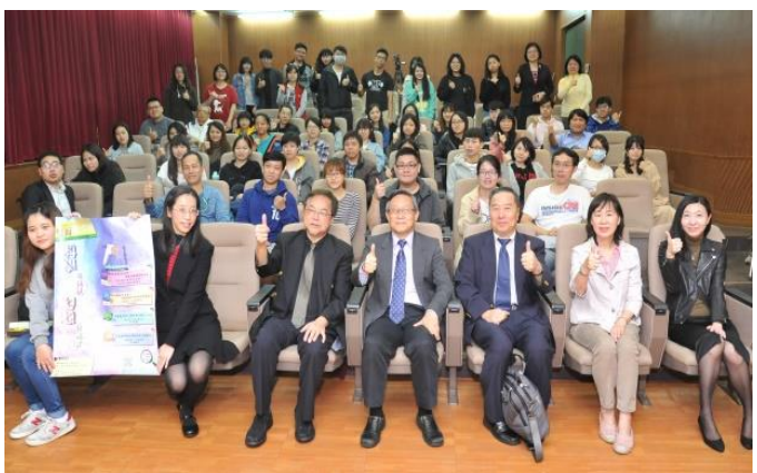
本校師生期待「雙面張系國－科學的浪漫、幻想的現實」系列講座活動