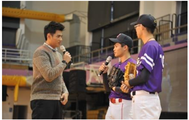
陳偉殷詢問兩位清華棒球隊投手想改善的問題