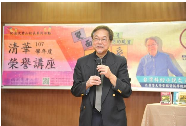
張系國教授向本校師生簡介未來 4 場講座活動