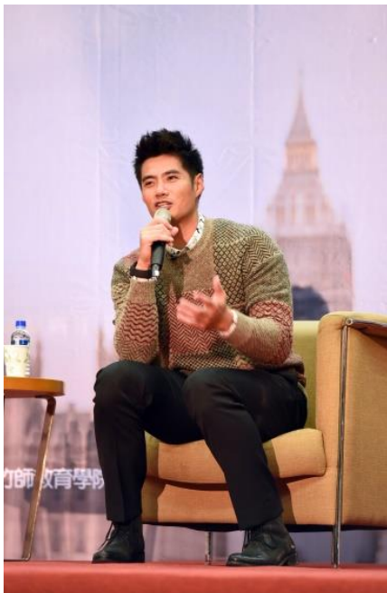
陳偉殷向學生分享在大聯盟訓練的心路歷程