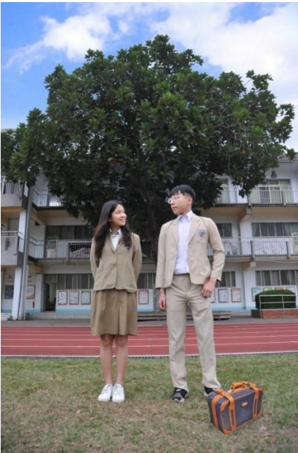
新竹師專生穿著制服、手提行李箱，在麵包樹下度過5年校園生活