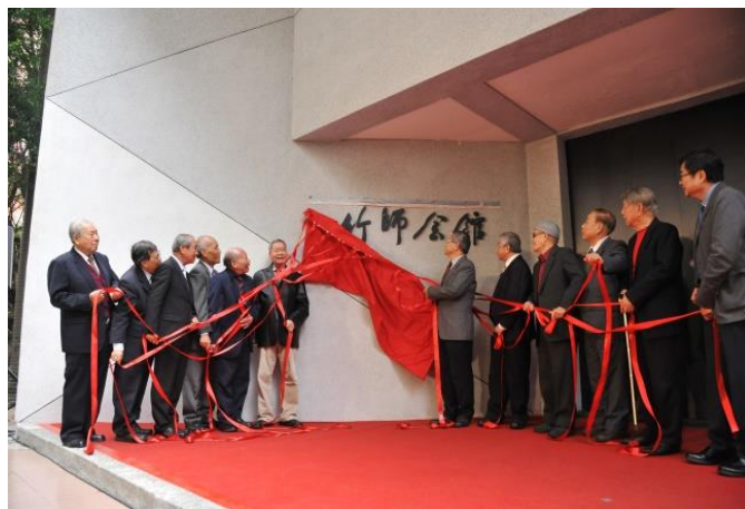
本校竹師會館 1 月 15 日揭幕啟用