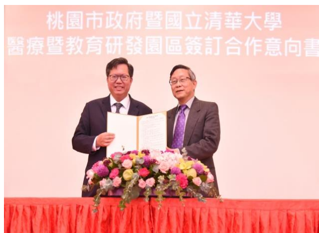
本校與桃園市政府簽訂「醫療暨教育研發園區合作意向書」，由賀陳弘校長（右）與桃園市鄭文燦市長（左）代表簽約