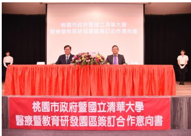
本校與桃園市政府簽訂「醫療暨教育研發園區合作意向書」，由賀陳弘校長（右）與桃園市鄭文燦市長（左）代表簽約