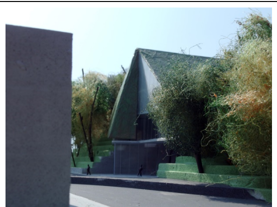
本校文學館意象圖