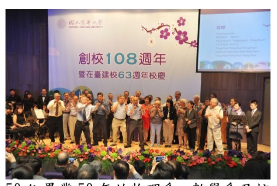
50位畢業50年的物理系、數學系及核工系校友熱情地登台帶動現場師生齊呼校呼