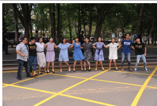
本校音樂系學生4月24日在小吃部前的野台帶來「百老匯音樂劇」快閃表演