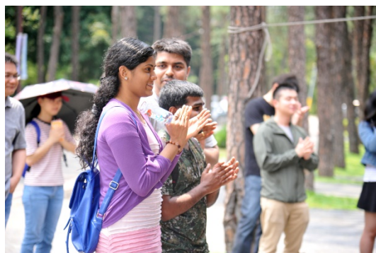
清華「擊樂之聲」快閃吸引外籍生跟著節奏一起打拍子