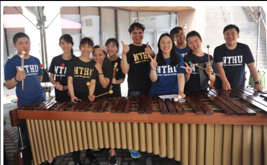
本校4月22日中午一場打擊樂快閃音樂會，為校慶慶祝活動拉開序幕