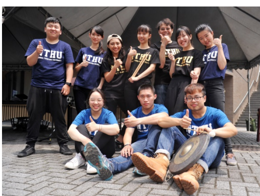
本校音樂系師生本周一到周五連著5天的中午將在旺宏圖書館周邊及小吃部前的野台帶來一系列音樂快閃表演