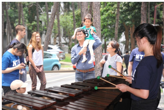
本校音樂快閃吸引路過師生、民眾駐足聆賞