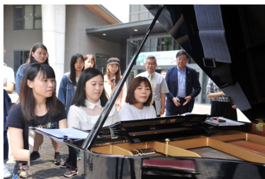
本校4月23日中午音樂快閃表演為鋼琴多手聯彈