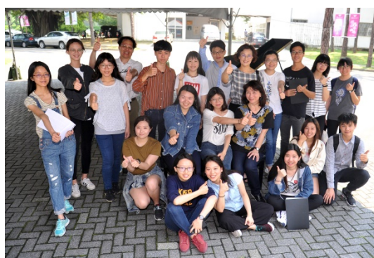
鋼琴多手聯彈的演出成員除音樂系學生外，還有電機系、工工系及畢業校友