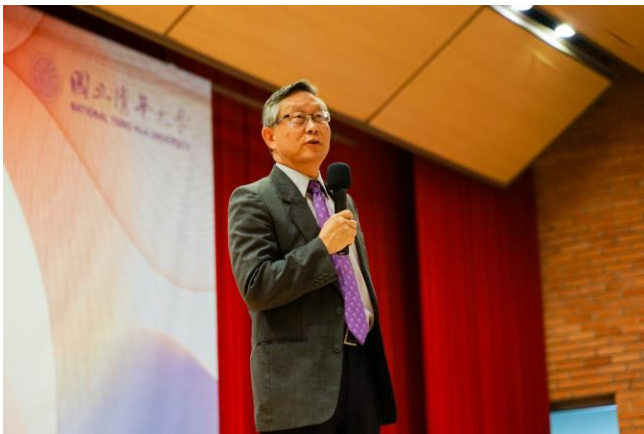
本校賀陳弘校長說，張忠謀創辦人很重視人才的培育，也有獨特的看法