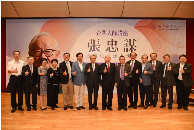
許多企業經理人也來聽張忠謀先生談「總經理的學習」