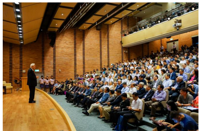
張忠謀先生是清華企業大師講座邀請的第一人