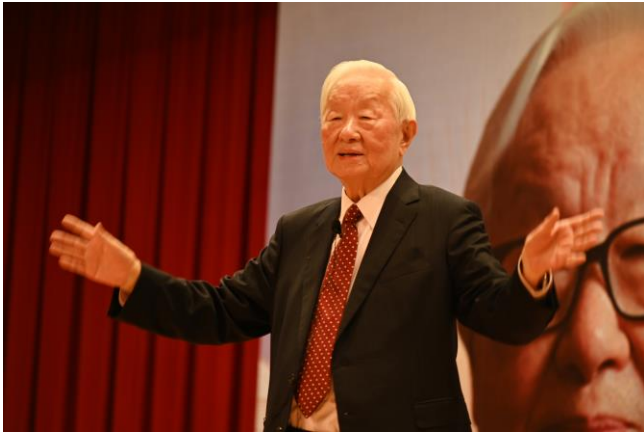
台積電創辦人張忠謀先生：領導最重要的是凝聚團隊的能力