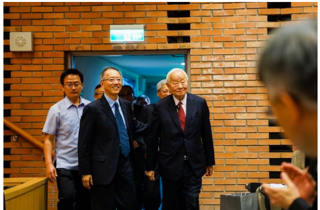
台積電創辦人張忠謀先生（右）以「總經理的學習」為題至本校發表演講