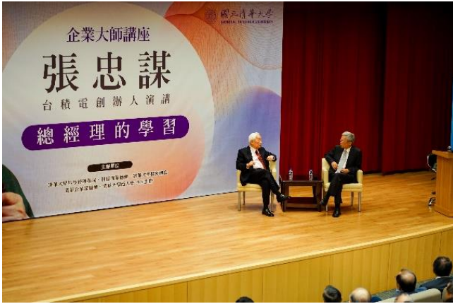
張忠謀先生（左）是清華企業大師講座邀請的第一人