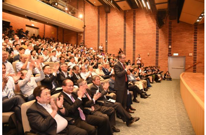
許多企業經理人也來聽張忠謀先生談「總經理的學習」