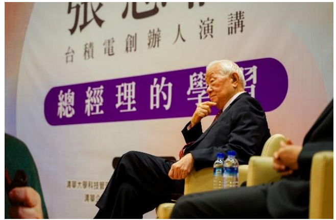
本校在企業大師講座請來台積電創辦人張忠謀先生，以「總經理的學習」為題發表演講