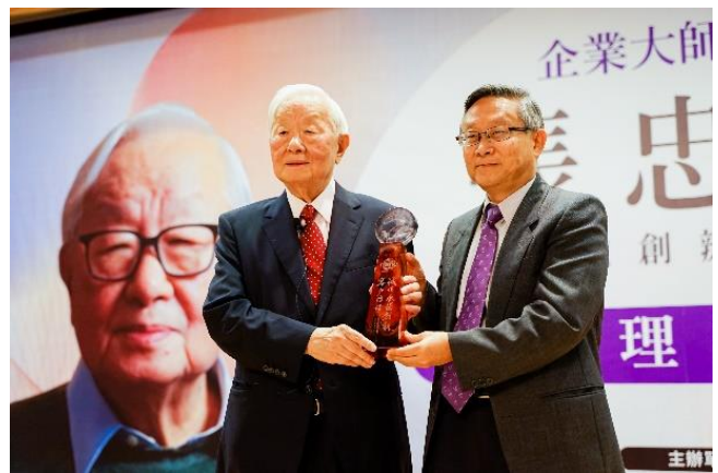
本校賀陳弘校長（右）致贈紀念品給台積電創辦人張忠謀先生