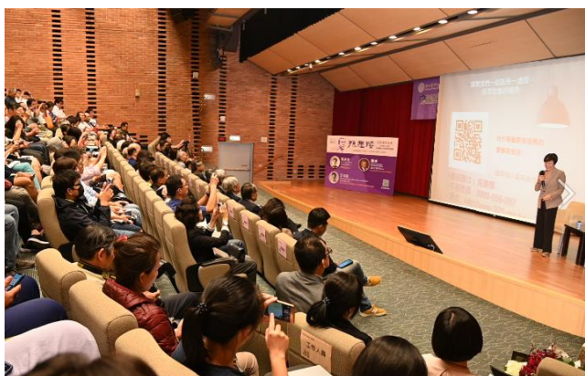
張淑芬董事長呼籲聽眾拿出手機掃描二維條碼，加入送愛心的行列