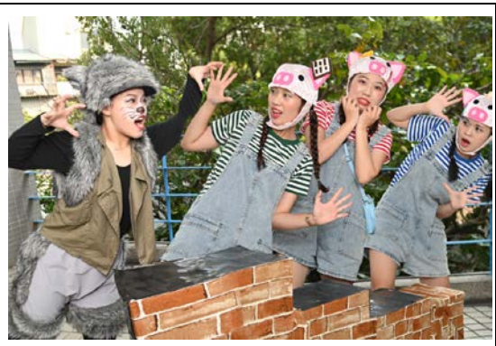
清華幼兒劇改編三隻小豬與大野狼的童話故事