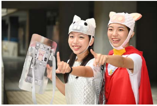
清華幼兒劇裡有會開飛機的紅豬及很會使用科技的麝香豬