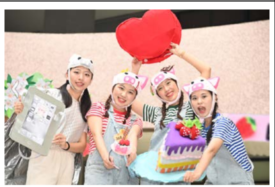
幼兒劇每年都由幼教系大四的同學演出、大三的同學製作道具