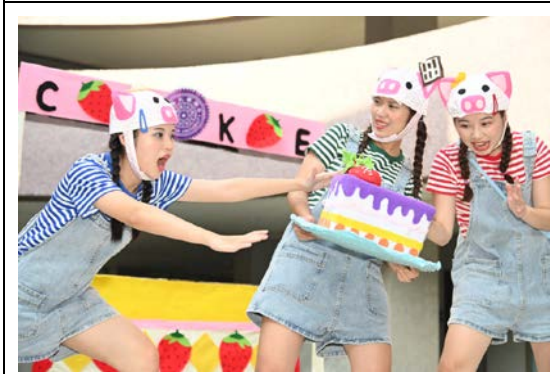
清華幼教系同學會依照角色的個性，精心設計服裝與道具