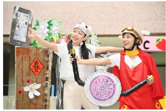
清華幼兒劇裡有會開飛機的紅豬及很會使用科技的麝香豬